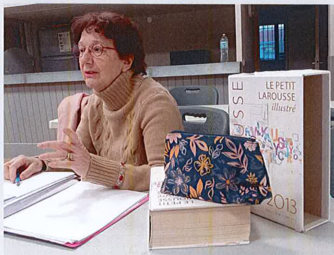
Propos recueillis par Line Chauvin