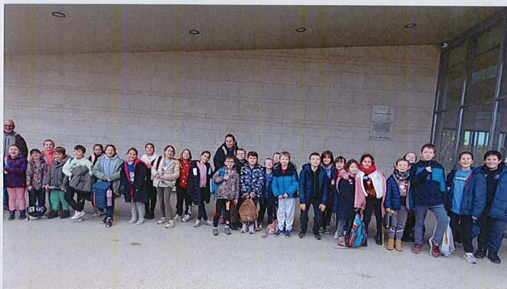
Prêts pour la baignade...

Nous débutons notre projet natation qui va se dérouler tous les mardis après-midis de Décembre à Mars.