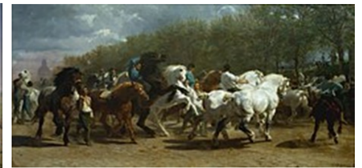
Rosa Bonheur - Le marché aux chevaux , 1853. Metropolitan Museum of New York