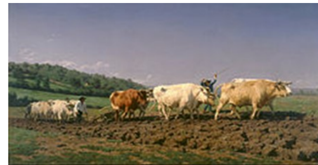
Rosa Bonheur - Labourage nivernais , 1849. Musée d'Orsay