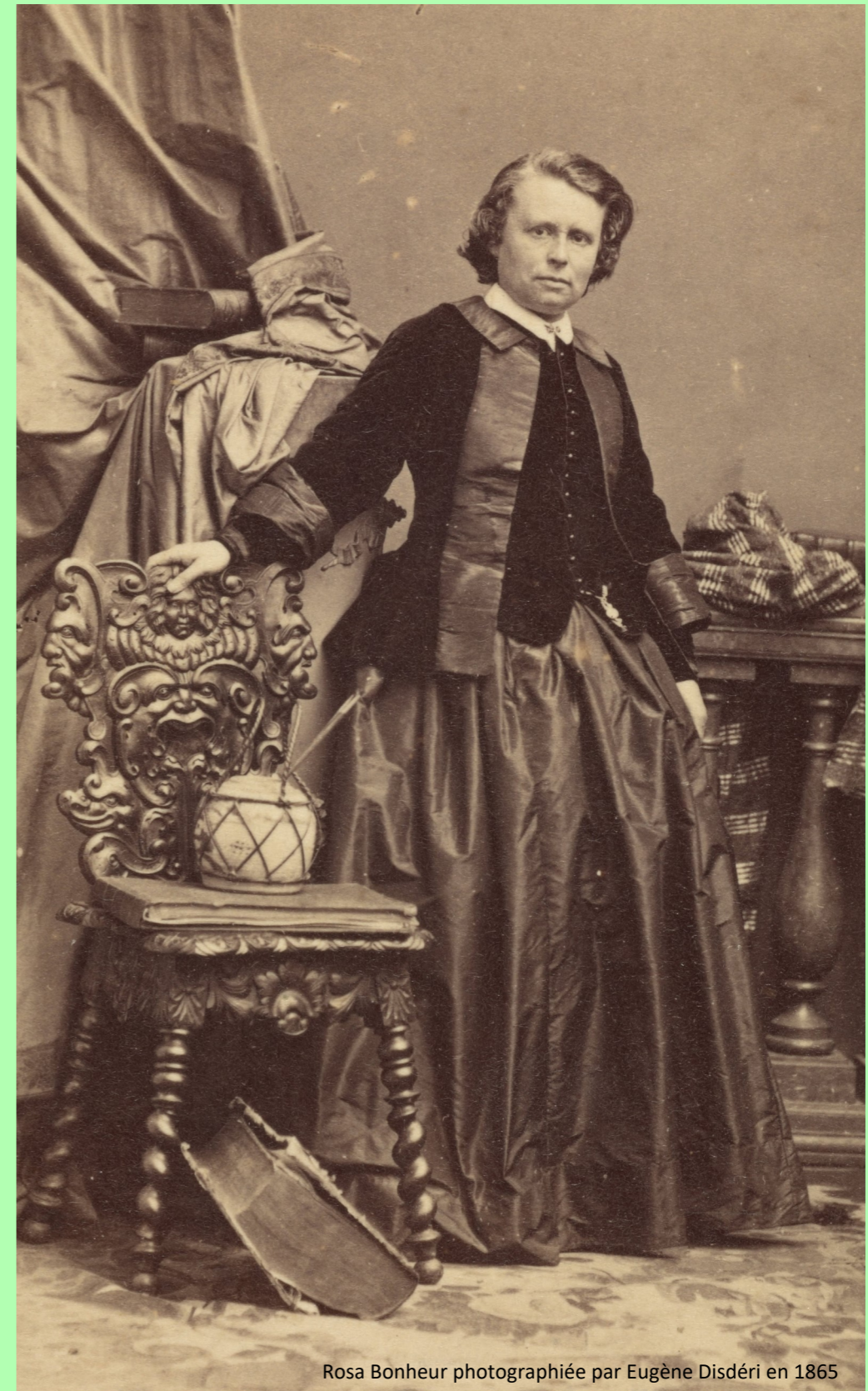
Rosa Bonheur photographiée par Eugène Disdéri en 1865

On a hâte de voir vos œuvres ! Ta production sera peut-être publiée dans le prochain numéro.