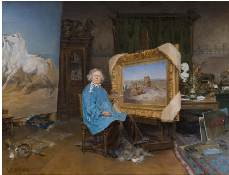
Georges Achille-Fould, Portrait de Rosa Bonheur

Le musée des Beaux-Arts de Bordeaux* n'est pas le seul à rendre hommage à la dessinatrice, peintre et sculptrice Rosa Bonheur, à l'occasion du bicentenaire de sa naissance. En effet, la commune de Civrac s'associe à la reconnaissance de cette artiste en choisissant de baptiser son école « Ecole publique de Civrac Rosa Bonheur ».